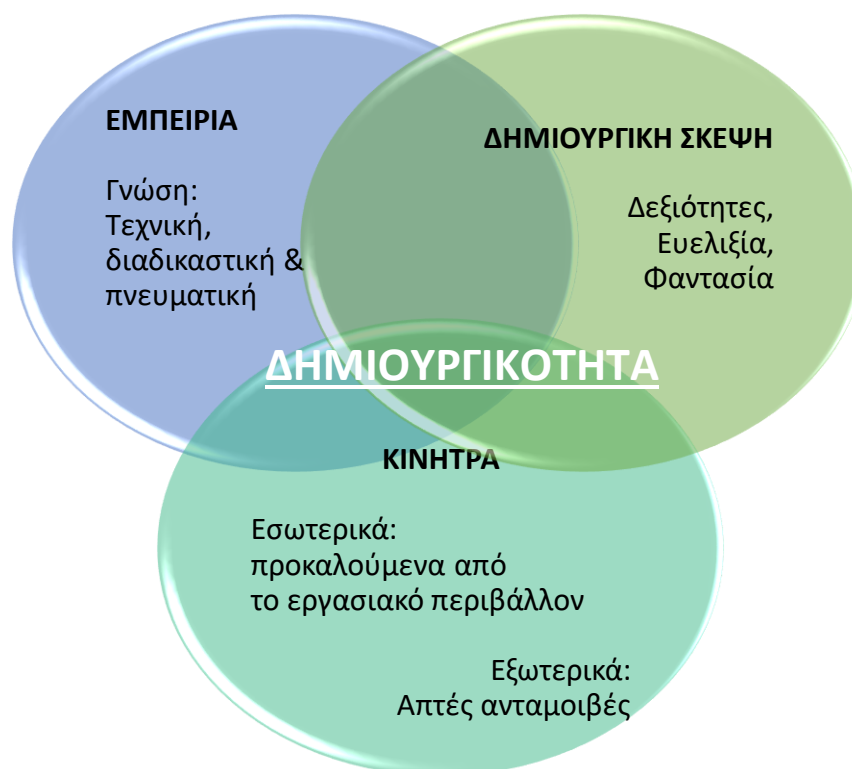
Σχήμα 1. Τα 3 συστατικά της Δημιουργικότητας